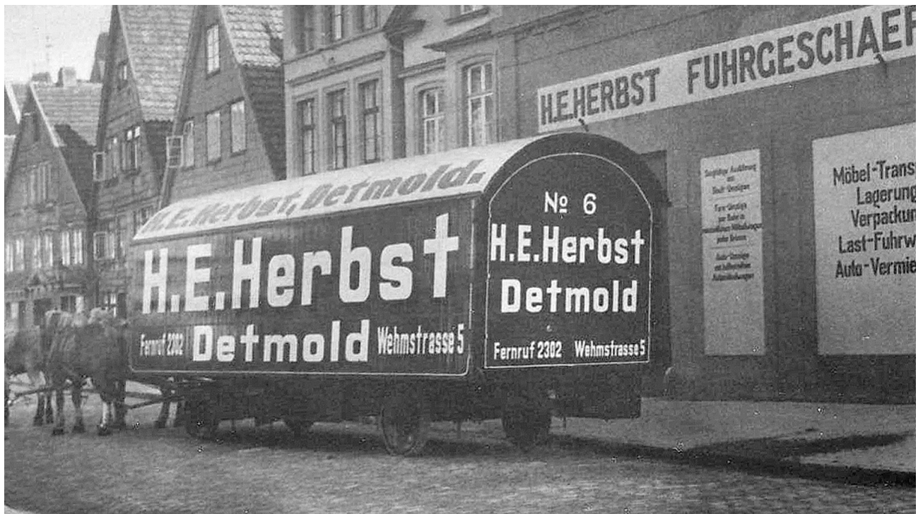
Eine lange Tradition: 2016 feierte DMS Herbst das 200. Firmenjubiläum