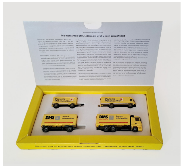
Jubiläumsbox der DMS aus 2018