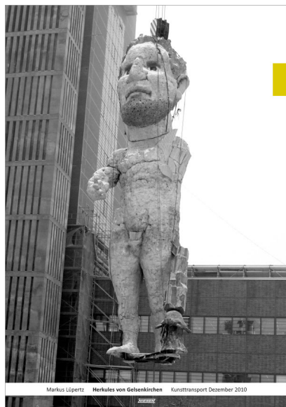
Markus Lüpertz Herkules von Gelsenkirchen Kunsttransport Dezember 2010