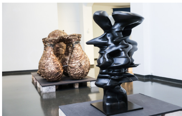
Skulpturen von Anthony Cragg