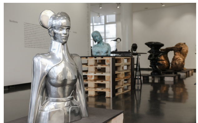
Skulpturen und Archivalien in der Ausstellung