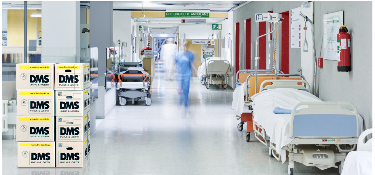
Symbolfoto © upixa | Fotolia.com

Schaumburg – Ende November 2017 begleitete DMS Friedrich Friedrich den Umzug zweier Kliniken in einen gemeinsamen Neubau. In der zweitägigen Hauptumzugsphase transportierte der Logistiker neben 5.000 Umzugskisten einen Großteil des täglichen Equipments der Krankenhäuser in die neue Immobilie.