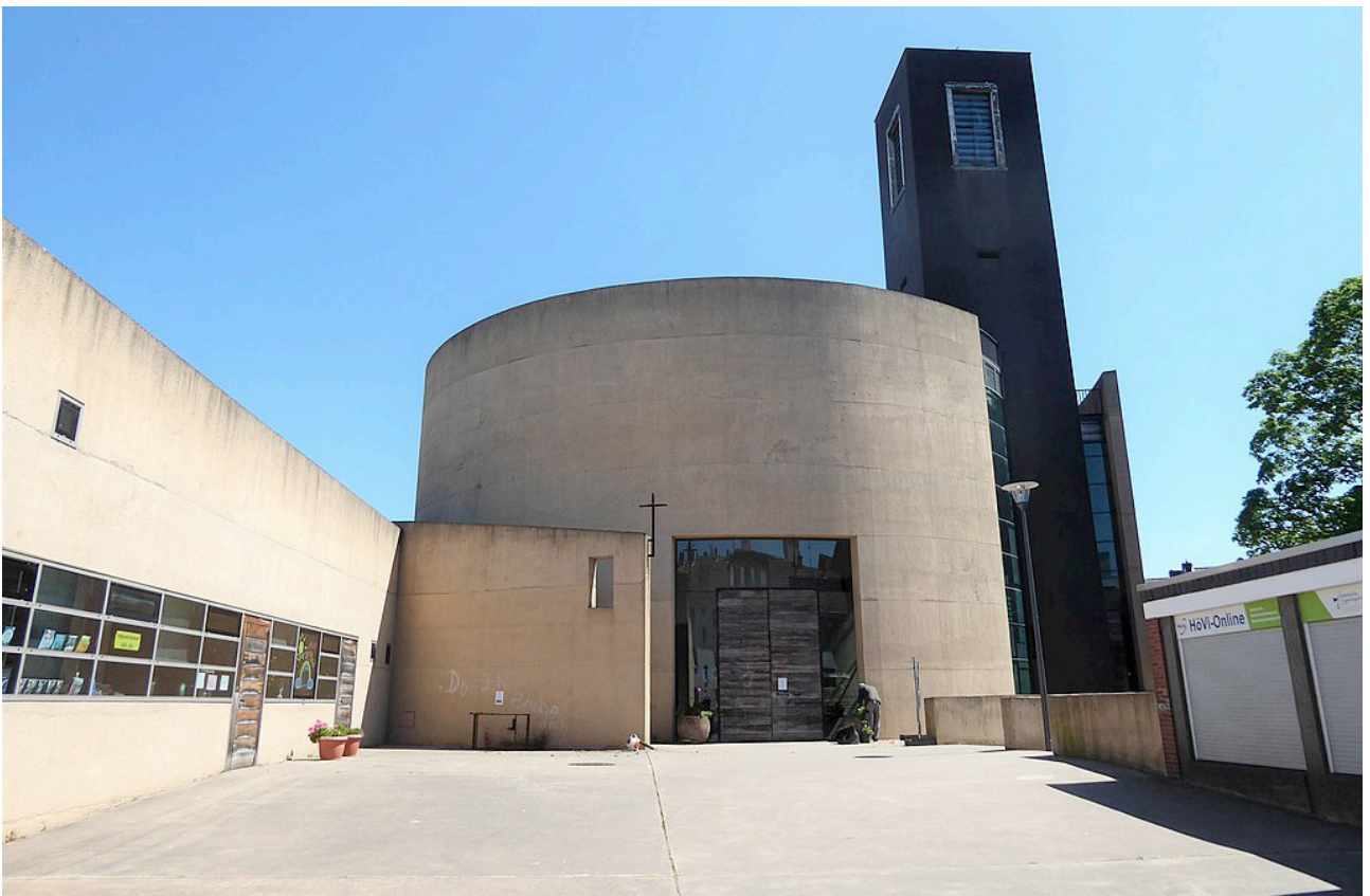
Kirche St. Theodor der Pfarrei St. Theodor und Elisabeth

Umzugslogistiker DMS Achnitz holt die gespendeten und in der Schule gesammelten Spielsachen ab und transportiert diese dann zur Gemeinde. Was bei diesen Aktionen zusammenkommt, versetzt auch die Siegburger Umzugsspedition immer wieder in Staunen. Beim DMS-Betrieb freut man sich, wenn der Transporter der Spedition einmal mehr bis zum Bersten voll ist.