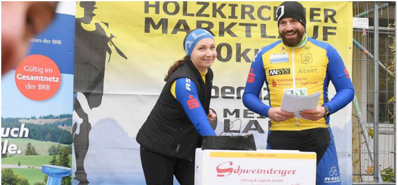
Auslosung der Preise 2020

Holzkirchen – 2020 musste der mittlerweile traditionelle Holzkirchener Marktlauf in seiner üblichen Form ausfallen. Damit keine Lücke in der Historie des Sportevents entsteht, dachten sich die Initiatoren ein besonderes Konzept aus. DMS Schweinsteiger unterstützte bei der Umsetzung.