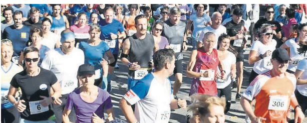
Läufer in 2019

Im Rahmen eines virtuellen Marktlaufs konnten Läufer die beiden festgelegten Strecken einfach selbst ablaufen. Die benötigte Zeit wurde online per App an den Radsport- und Laufclub Holzkirchen (RSLC) übertragen, der den Marktlauf organisiert. Der Lauf fand nicht wie üblich an einem einzigen Sonntag statt. Vielmehr hatten die Sportler den gesamten Oktober Zeit, um die Strecken zu absolvieren. Preise wurden unter allen Teilnehmern einfach verlost, so dass die Laufzeit diesmal nur eine untergeordnete Rolle spielte.