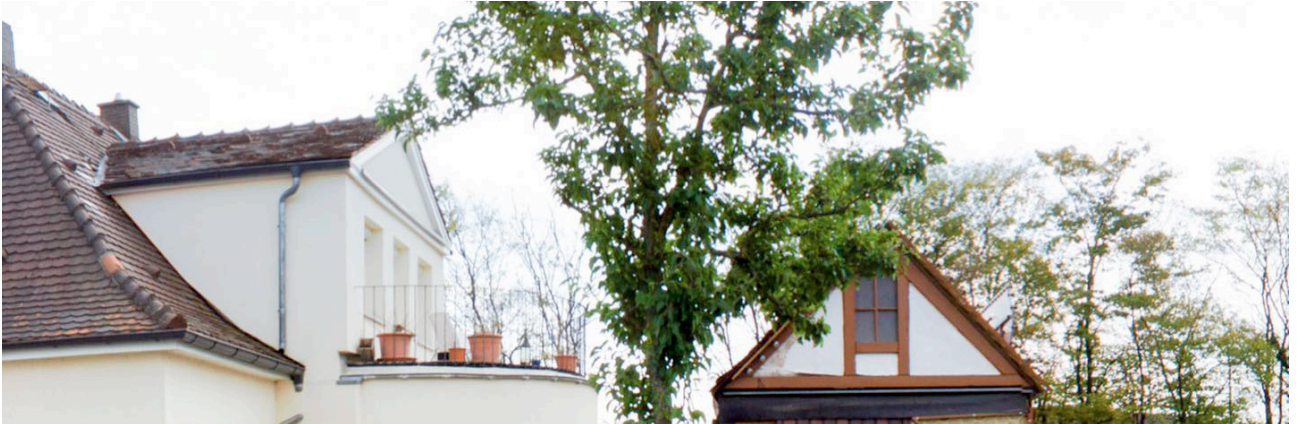
Neue Gebäude von DMS Friedrich Friedrich

Griesheim / Mainz – Die Friedrich Gruppe vergrößert sich. DMS Friedrich Friedrich übernimmt am Griesheimer Stammsitz eine zusätzliche Gewerbefläche im Umfang von 5.000 qm. Neben der 1.000 qm großen Lagerhalle verfügt diese über Büros und Freiflächen. Derweil erweitert der Mainzer Umzugslogistiker DMS Höhne-Grass das Selfstorage-Angebot am Standort Mainz um 1.000 qm.