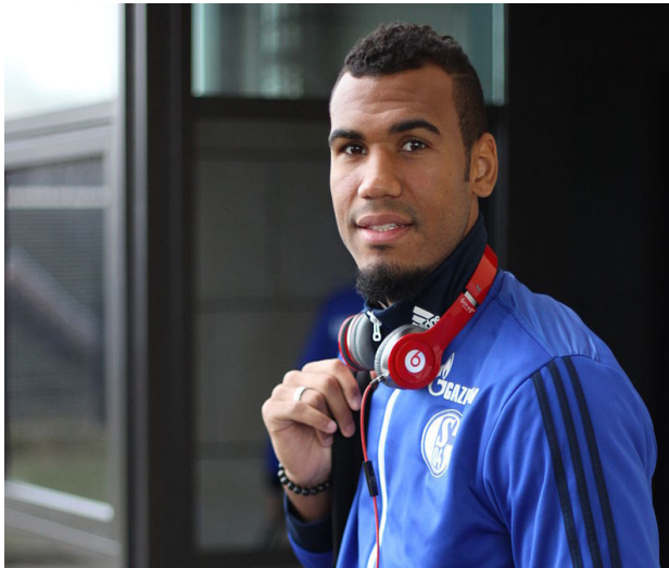
Eric Maxim Choupo-Moting

Ex-Bundesligaprofi Eric Maxim Choupo-Moting hat eine neue sportliche Heimat bei Stoke City gefunden. Der Düsseldorf-DMS-Betrieb Bartsch & Weickert übernahm den Umzug nach England. Das Unternehmen transportierte drei Container nach einer Lagerung auf »die Insel«.