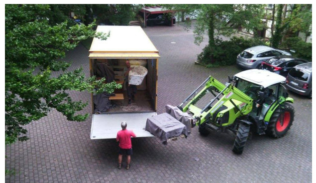
Beladetechnik »aus der Reihe« bei DMS Hartleb