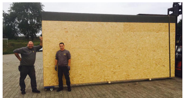
Frey & Klein verpackt Ölgemälde vor Transport in den Iran