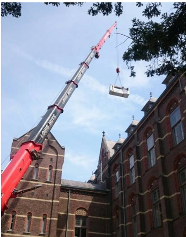
Umzug in höhere Etagen mit Kran bei DMS Schweinsteiger