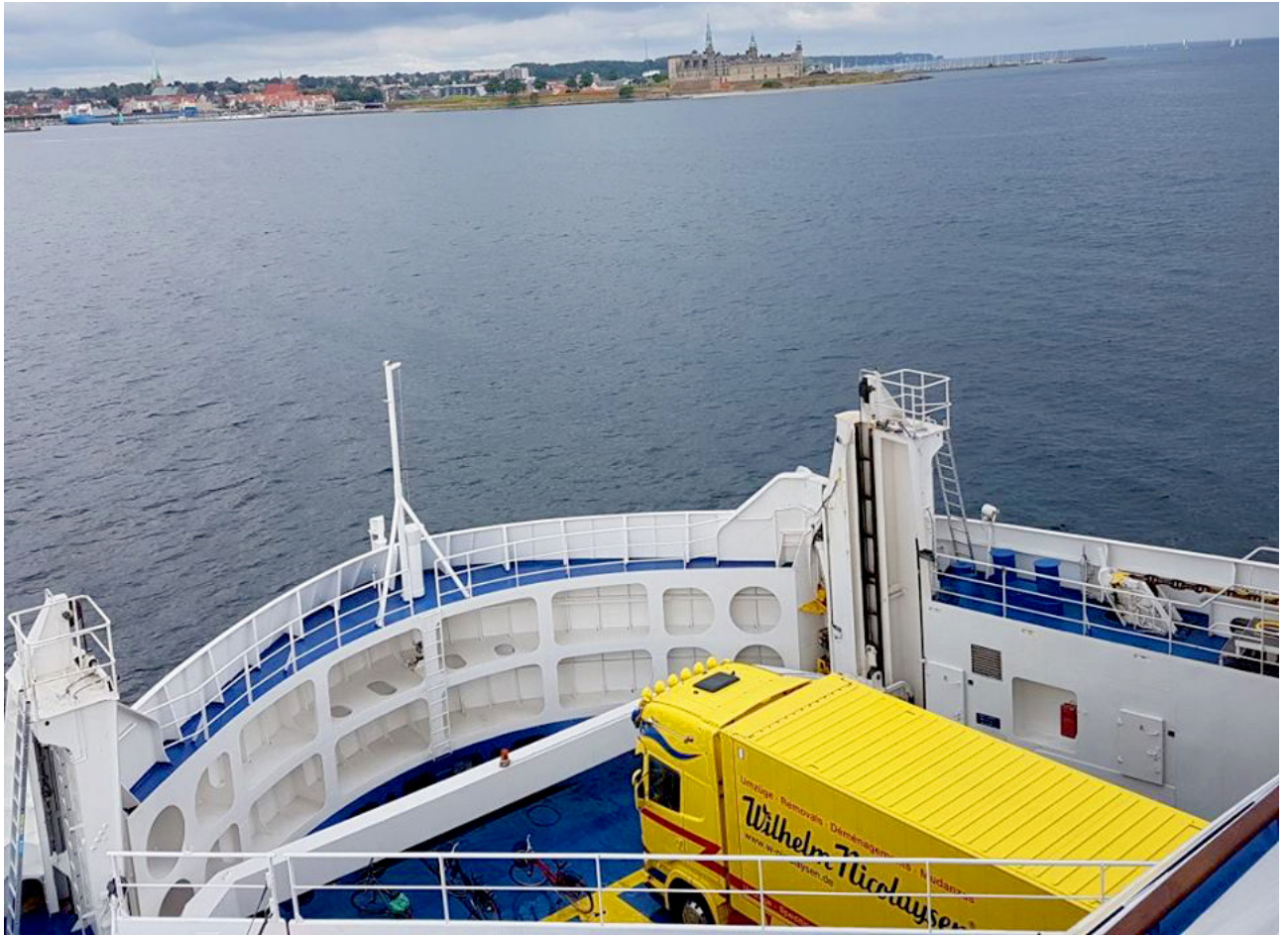
LKW von DMS Nicolaysen aus Husum beim Übersetzen nach Schweden