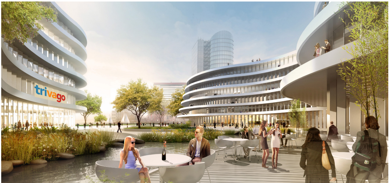
© trivago Headquarter, © sop architekten, Rendering: formtool

Düsseldorf – Im Juli 2018 bezogen 1.200 Mitarbeiter der weltweit größten Hotel-Suchmaschine trivago den neuen Campus im Düsseldorfer Medienhafen. Gleich zwei DMS-Betriebe sorgten mit einem vielseitigen Leistungspaket für die erfolgreiche Neumöblierung des Gebäudes und den späteren Firmenumzug.