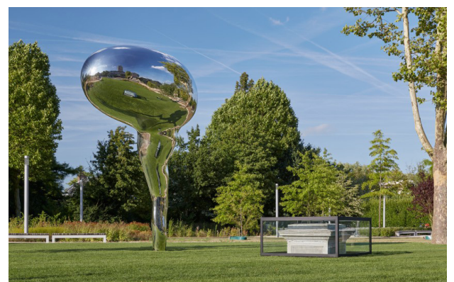
Sprechblase im Gesamtkonzept »Stein des Weisen«

Ein neues Wahrzeichen der Universität und Stadt war geschaffen. Vor der Sprechblase stehend sollen die Betrachter zu einer Auszeit kommen und »ihre Gedanken reflektiert sehen«, so eine Beschreibung des Kunstwerks. Und als Fotomotiv eignet sich die »Sprechblase« ohnehin.