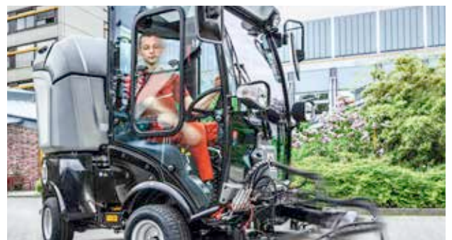
Fotos: Tätigkeitsfelder Dussmann